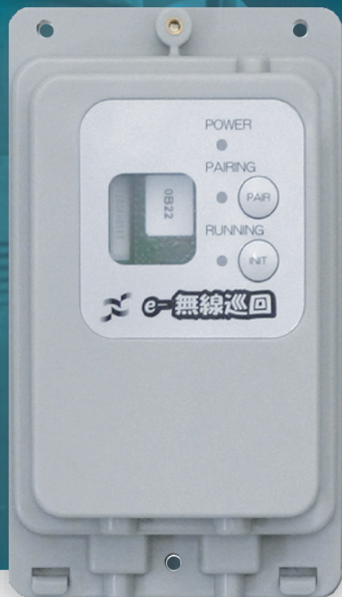
e-Fujiyama wireless sensor Model number: EFJ-S001