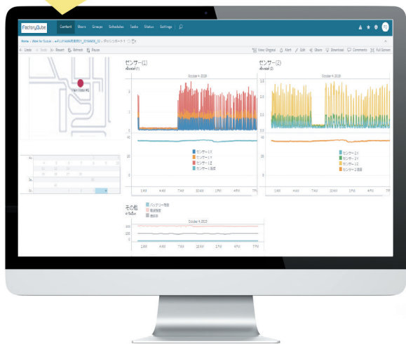
S:UU Cloud Service